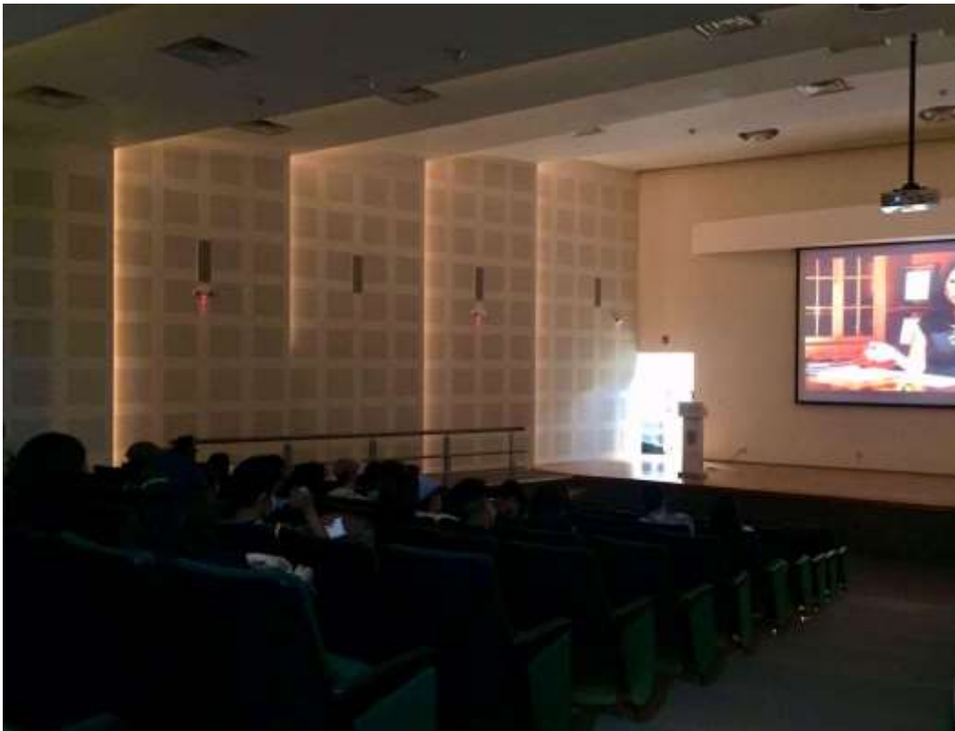
Proyección del documental "La historia invisible" del INE, septiembre de 2021.